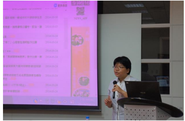
圖 2-跨庫就上手-燕巢場