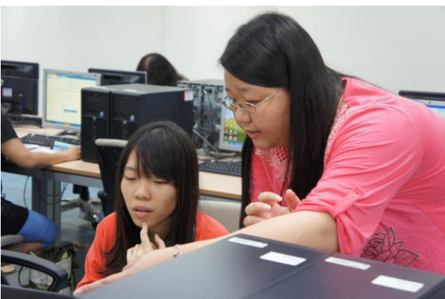
圖 5- EndNoteX7 說明會-燕巢場