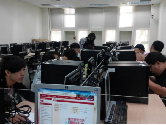
圖 1-綜合性資料庫導覽課程