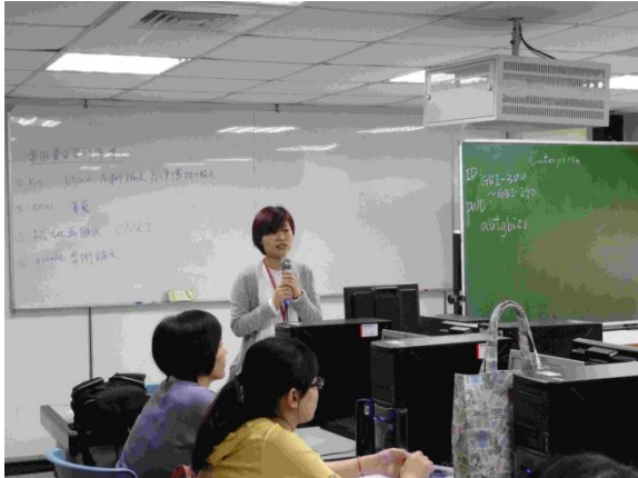
圖 3-音樂系研究生 Endnote 課程