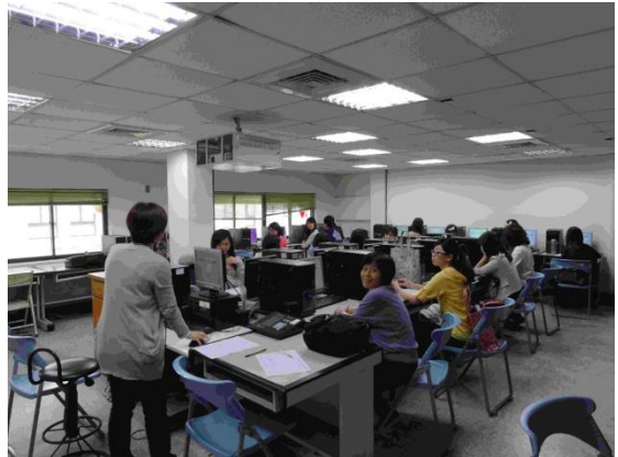
圖 4-音樂系研究生 Endnote 課程