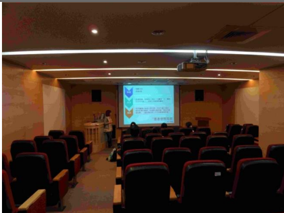
圖 5-暑碩特教所 Endnote 課程