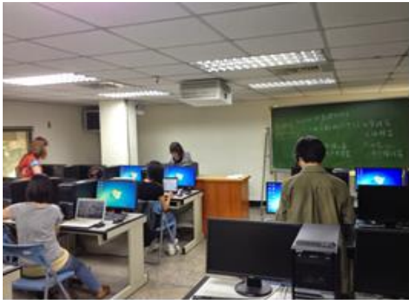
圖 7-研究生 EndNote X7 課程