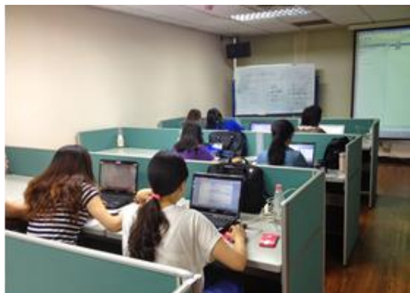
圖 11-研究生電子資源利用教育