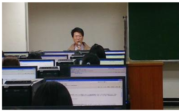
圖 4-研究生電子資源利用教育