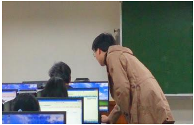
圖 2-研究生電子資源利用教育