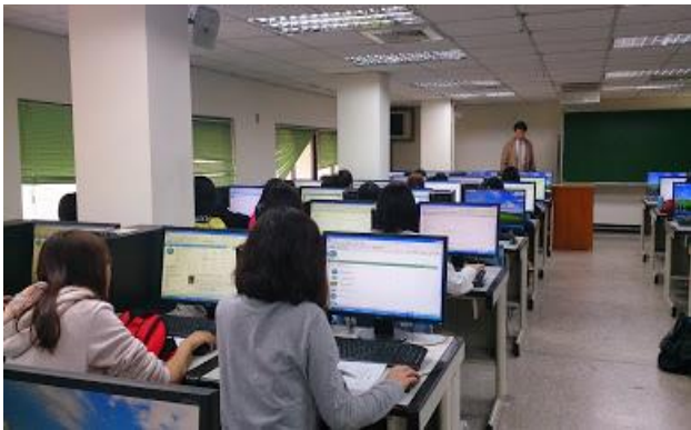
圖 3-研究生電子資源利用教育