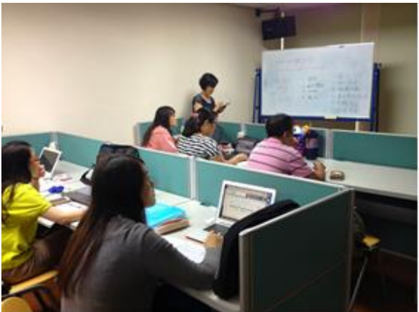
圖 9-研究生電子資源利用教育