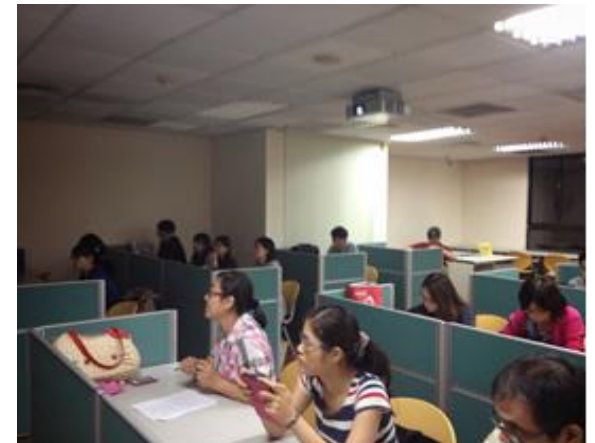
圖 10-研究生電子資源利用教育