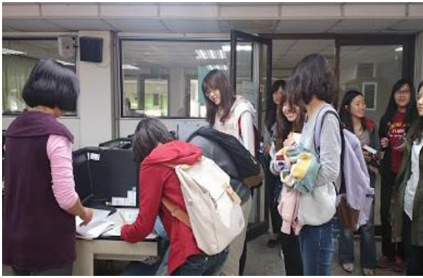
圖 1-研究生電子資源利用教育