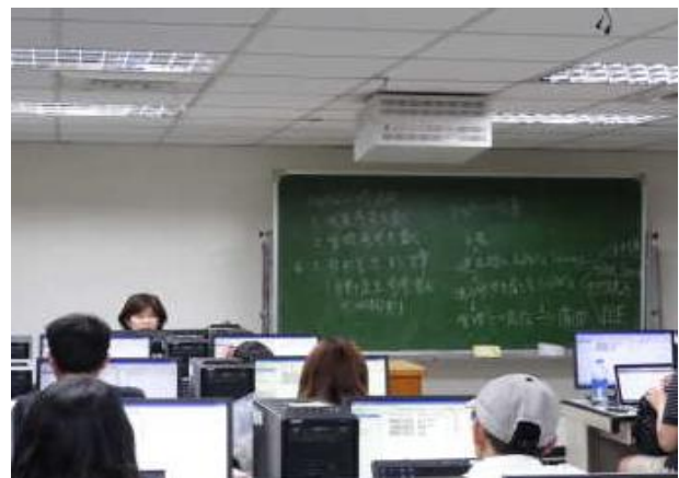
圖 4-研究生電子資源利用教育