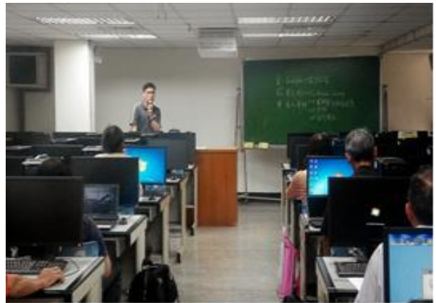
圖 8-EndNote X7 課程