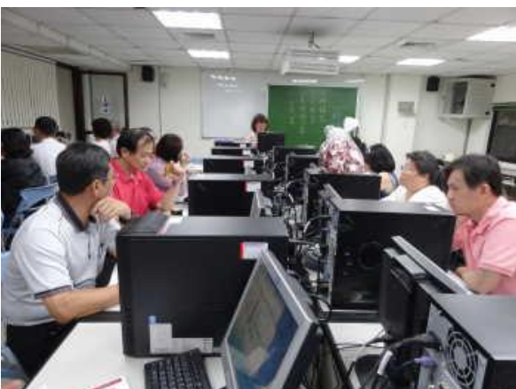
圖 5-研究生電子資源利用教育