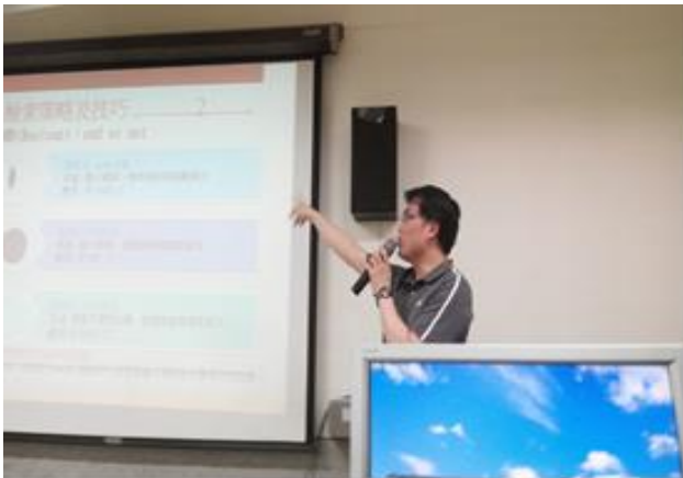
圖 7- 電子資源課程