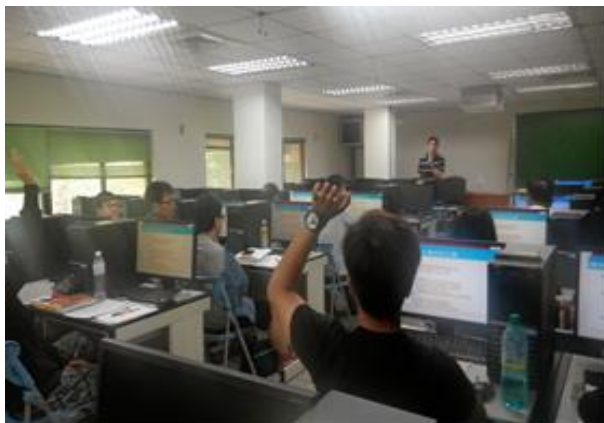
圖 9-EndNote X7 課程