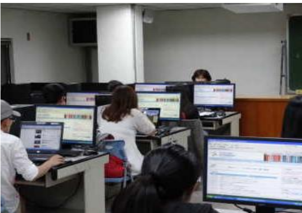
圖 3-研究生電子資源利用教育